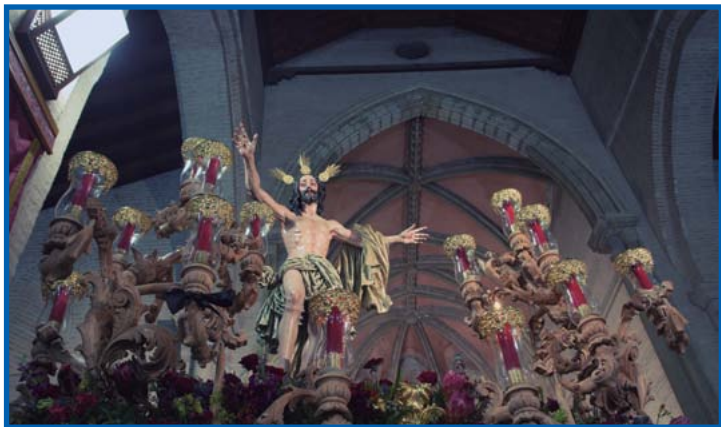
● El Señor de la Resurrección en Santa Marina.

Edita: Hermandad de la Sagrada Resurrección