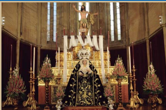
● Altar dispuesto para la celebración de la función y besamanos en honor de la María Santísima del Amor. / D.A.