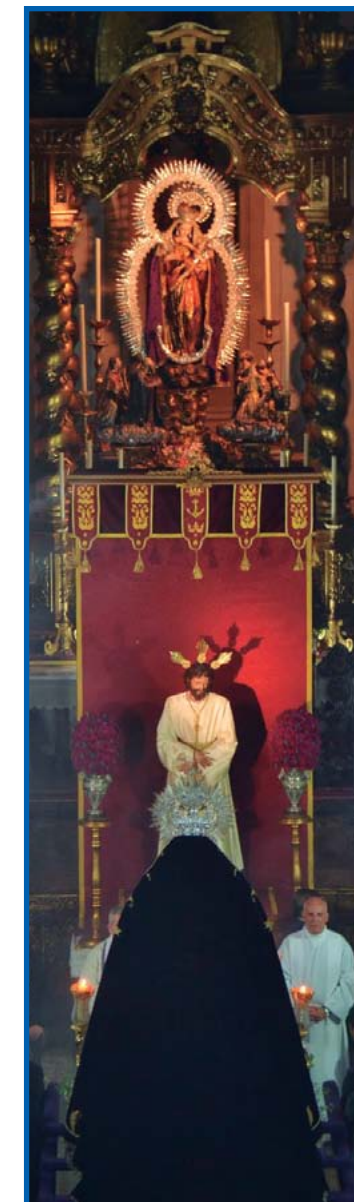
● El Viacrucis de 2014 en Omnium Sanctorum. / Reina de todos los Santos

El itinerario será el siguiente: Salida (19.00 horas), Santa Marina, San Luis, San Marcos, Bustos Tavera, Doña María Coronel, Dueñas, Espíritu Santo, Castellar, Churruca, Infantes, San Blas, Inocentes, San Luis y Santa Marina (21.30 horas). Se rezará el Viacrucis de San Juan Pablo II que contempla la Resurrección en su decimoquinta estación y acompañará la Capilla Musical de la Banda María Santísima de la Victoria "Las Cigarreras". ●