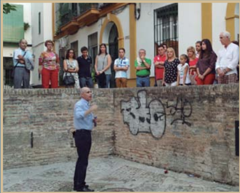
● Por primera vez nuestra hermandad participó en las actividades de "La Noche en Blanco". / D.A.