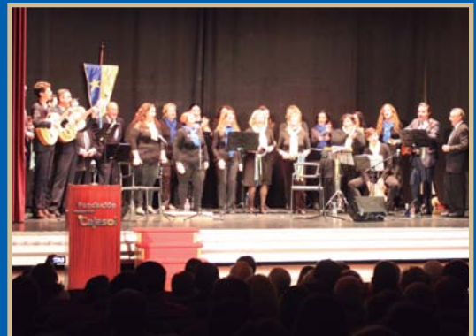
● Segunda edición del certamen benéfico "Resucitando la Navidad" en la Sala Chicarreros. / D.A.