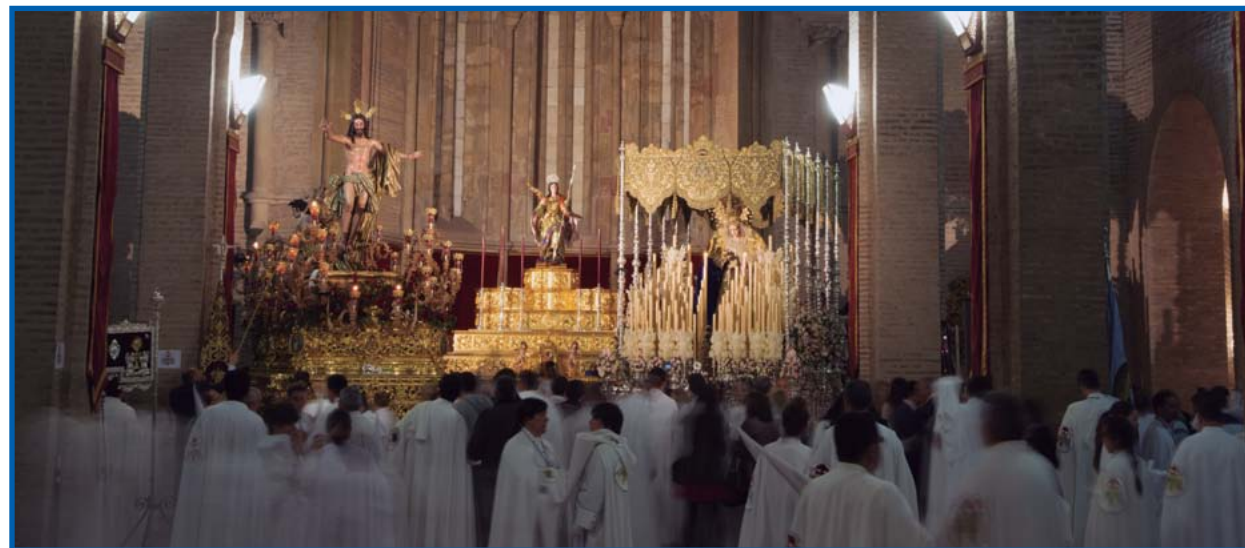
● El cuerpo de nazarenos espera

Por eso nuestro compromiso con la estación de penitencia debe comenzar del 16 al 21 de