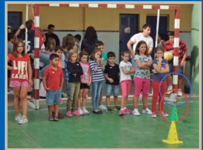
● Actividades organizadas por el Grupo Joven con los más pequeños. / D.A.