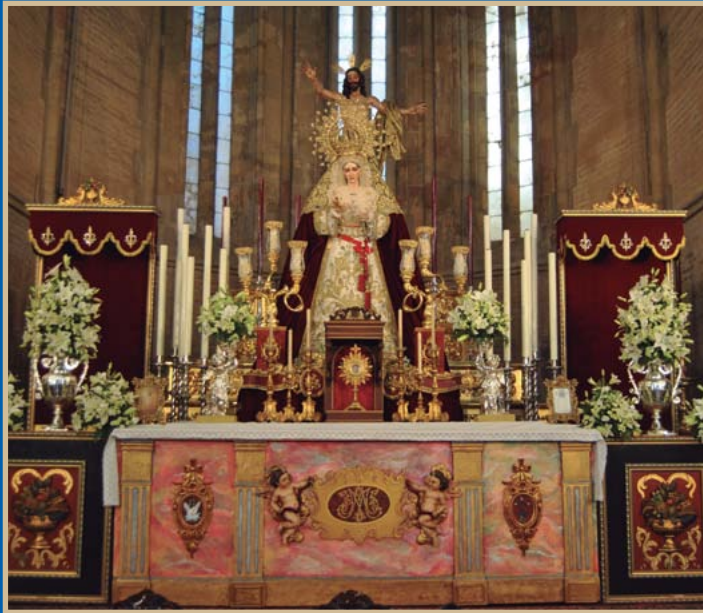
● Los días 5, 6 y 7 de septiembre celebramos en Santa Marina el tri-duo en honor de la Virgen de la Aurora.