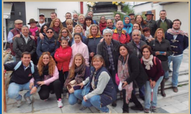
● Algunos de los participantes en la tradicional peregrinación a la ermita de la Virgen del Rocío.